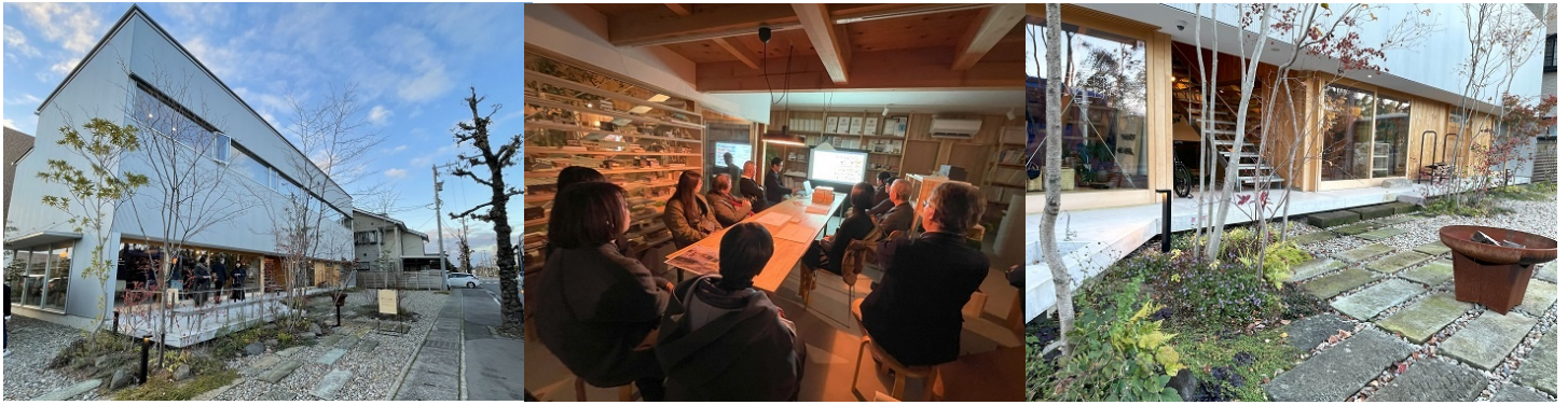
h-BASEは『憩う・働く・買う・住まう』人々が交わりつながらる複合施設 足元には福井地元石、笏谷石の再利用