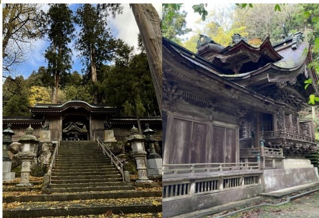
大瀧神社の本殿 と拝殿は江戸後 期に社殿建築の 粋を集めて建立