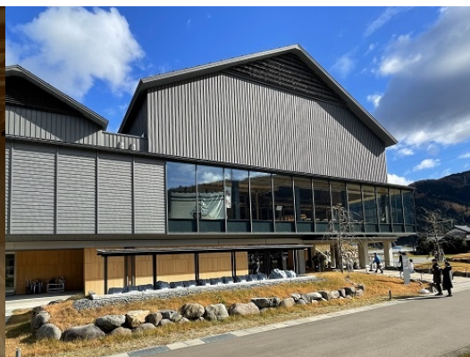
2階、朝倉館原寸再現から望 むは、実り豊かな里山の景色