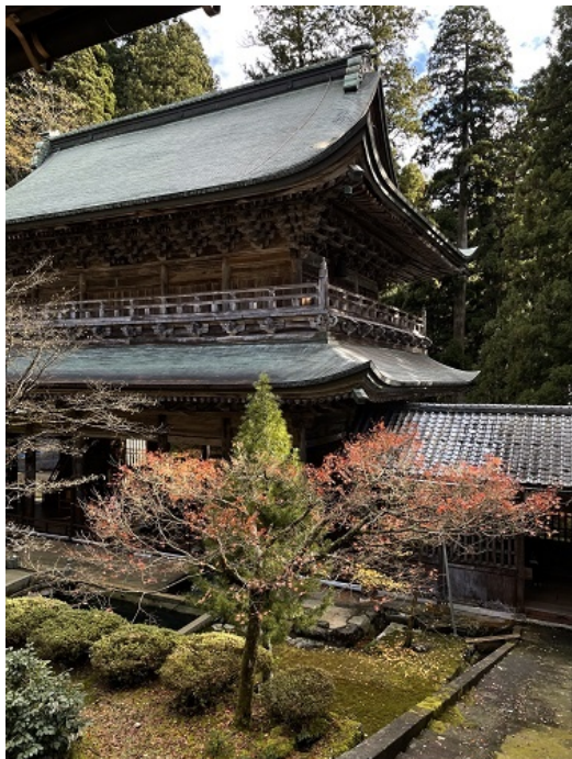
永平寺では坐禅体験を