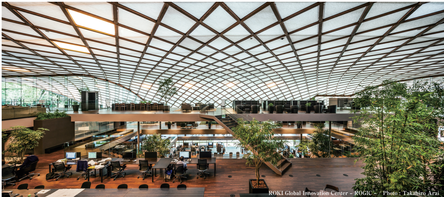
ROKI Global Innovation Center - ROGIC