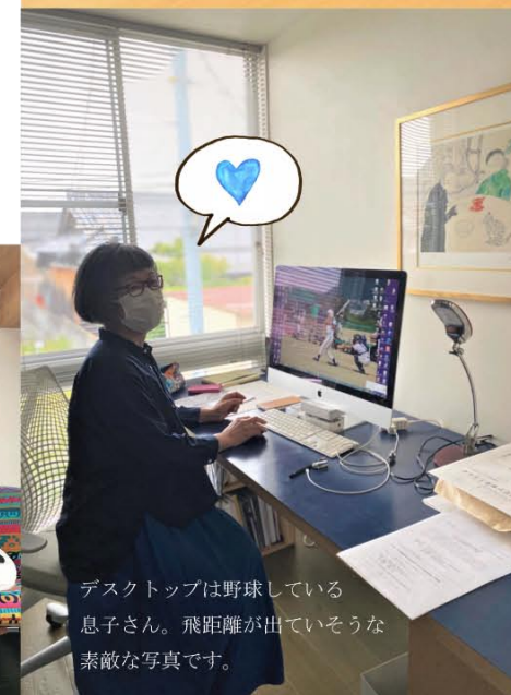
デスクトップは野球している 息子さん。飛距離が出ていそうな 素敵な写真です。