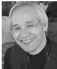
今川 憲英 Imagawa Norihide 外科医的建築家/エンジン01幹事

素材が生きる長寿命建築を造るプロ。建築の保存再生のプロ。日大建築学科卒。東京電機大学教授、構造デザイン事務所TIS&PARTNERS代表。地球温暖化防止にCO2を注入しO2を排出するECO建築を開発。国外20か国、国内全都道府県で2千以上建築を実現。日本建築学会賞、IASS坪井賞、「横浜赤レンガ倉庫」でユネスコ文化遺産保全のためのアジア太平洋遺産賞。著書「木による空間構造へのアプローチ」、文藝春秋06年2月号「耐震偽装マンションは日本病」他。