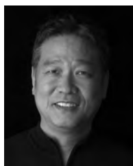
HASHI/橋村奉臣 Hashimura Yasuomi 写真家/エンジン01幹事

68年に渡米。74年NYにHASHI STUDIOを設立、世界の優良企業500社以上と仕事。同時に独創的なファインアートも次々と製作、代表作は国連限定アート「宇宙に架かる虹」エスクァイア誌50周年記念ポスター「喜び」を含む『一瞬の永遠』シリーズ、『未来の原風景』シリーズ、アメリカン・インディアンなど。近年はNYと東京に拠点を置き、HASHI国際写真塾を開設。大学・専門学校での講義、ポートフォリオレビューやワークショップなど後進育成も積極的に行っている。