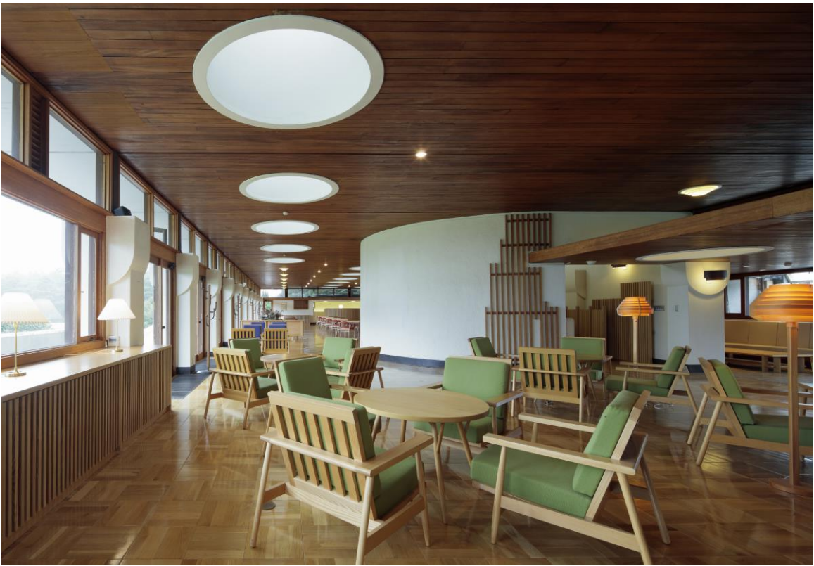
336嵐山カントリークラブクラブハウス