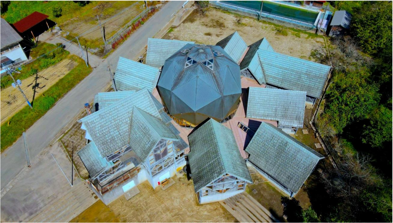
328西里テラス(旧 小国町立西里小学校)