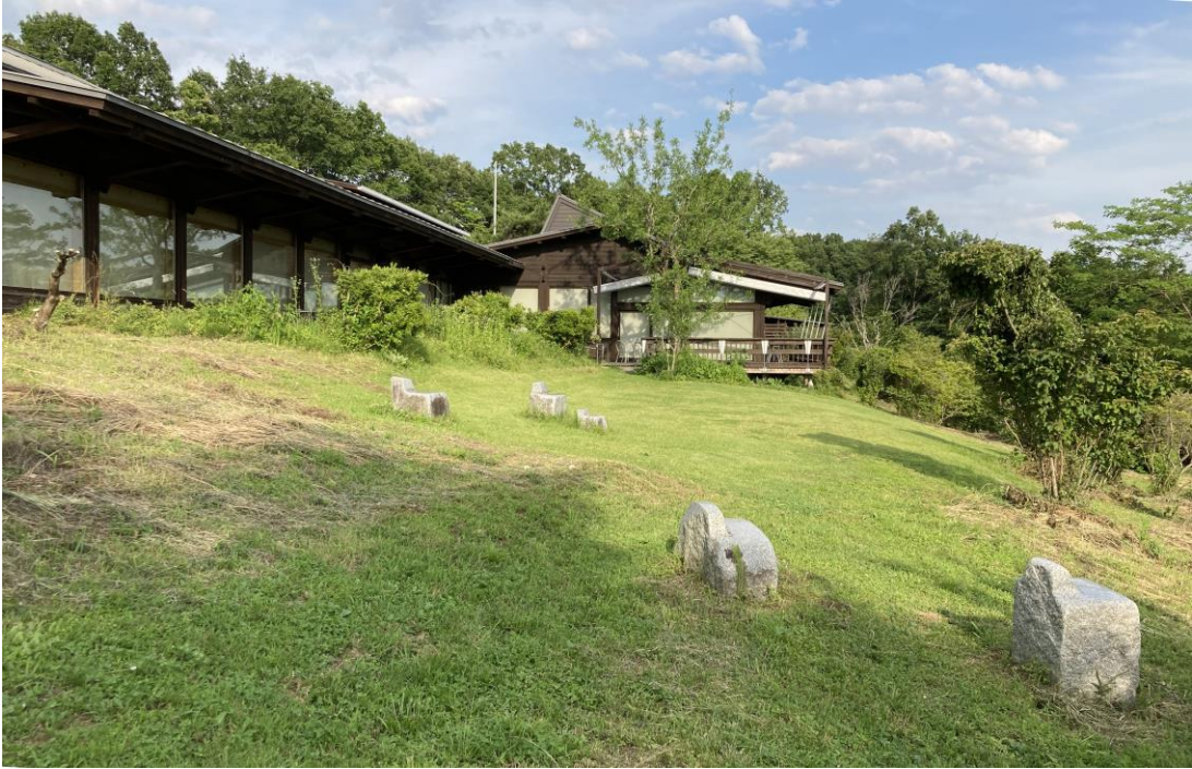
323いわむらかずお絵本の丘美術館