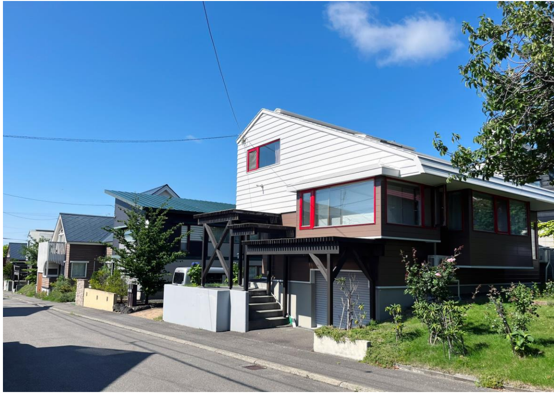
334パストラルタウン美しが丘