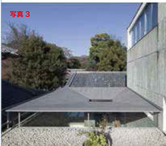
写真3のキャプション