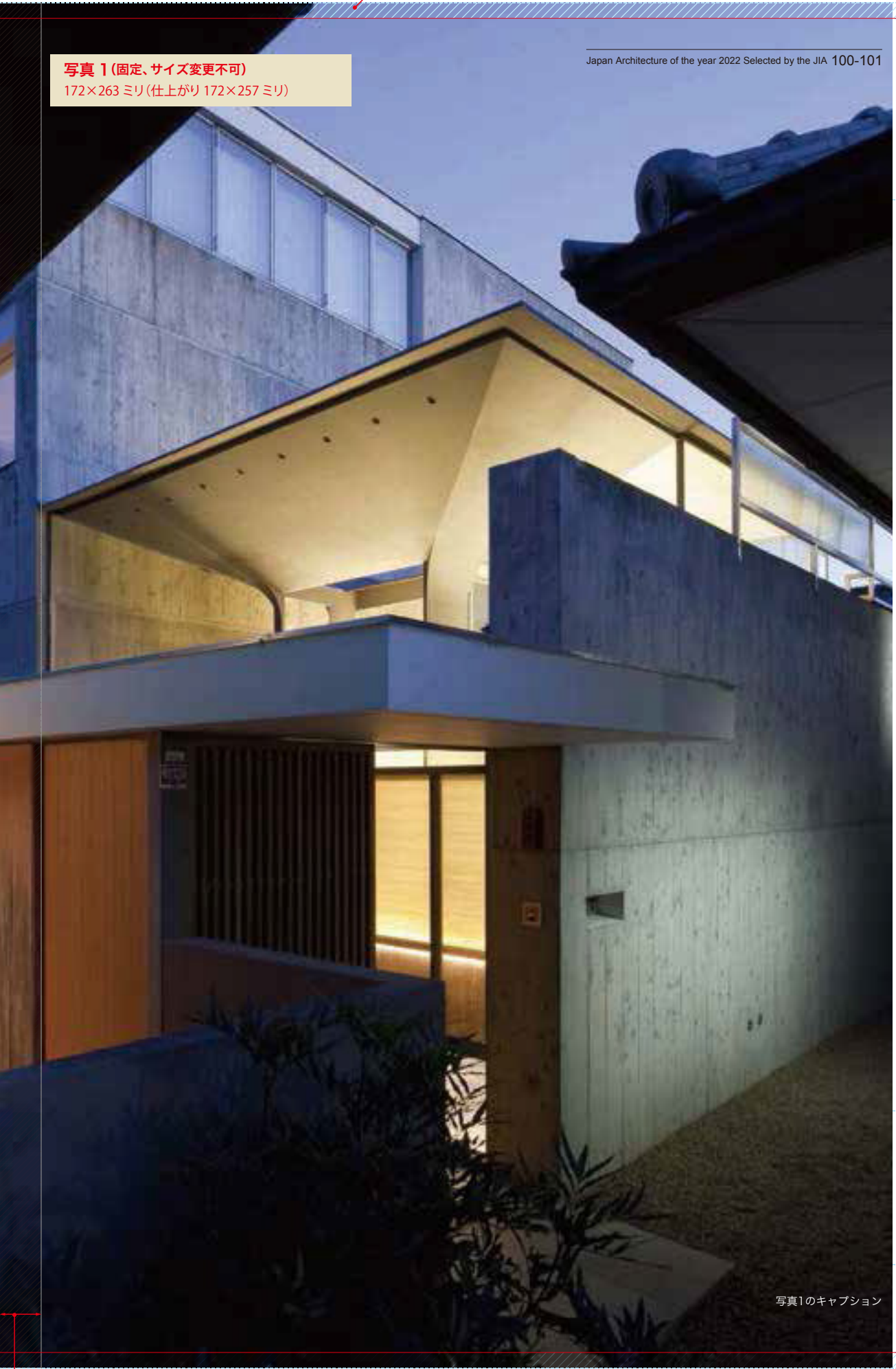
写真1のキャプション

□内は図面、写真のサイズ、位置可変スペース (例: 写真2スペースを二分割したり、写真3を図面スペースに)