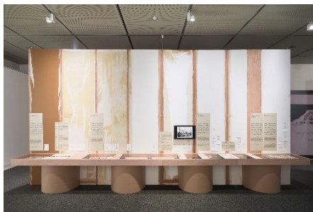
分離派建築展 Hayato wakabayashi