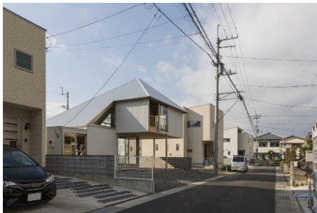
house T shinkenchiku-sha