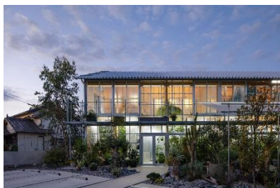
house/shop F Yosuke Ohtaka