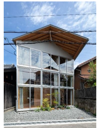
house I/atelier I Yohei sasakura