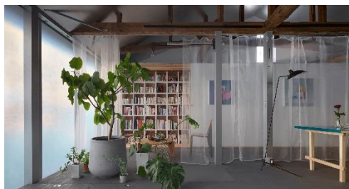
house/atudio O+U Yasushi ichikawa