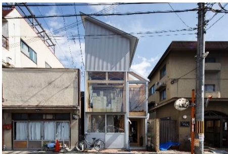
house A/shop B Yosuke Ohtaka