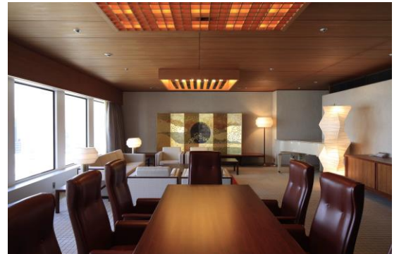
[京王プラザホテルインペリアル スイート] 1971年