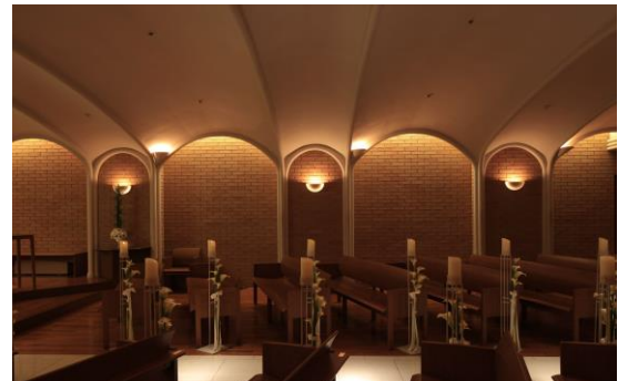
[ホテルメトロポリタンエドモント チャペル] 1996年