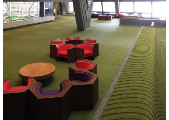
[国立京都国際会館インテリア] 1966年