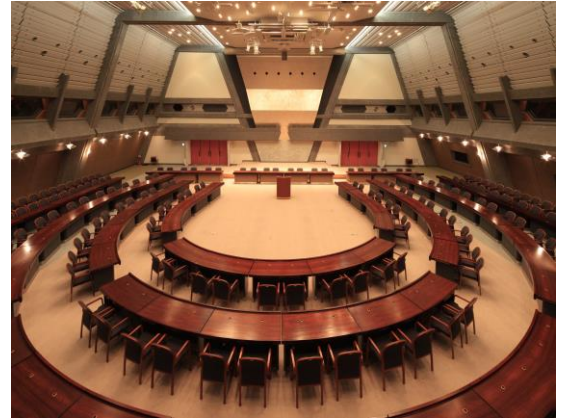
[国立京都国際会館 中会議室] 1966年