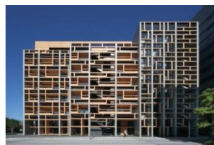
木材会館外観 ※山梨氏設計

チソカツとは、目の前にある素材をただ使うことにとどまらず、 地域にありふれたモノを別の視点からとらえなおすことで、新たな素材に仕立てあげることです。